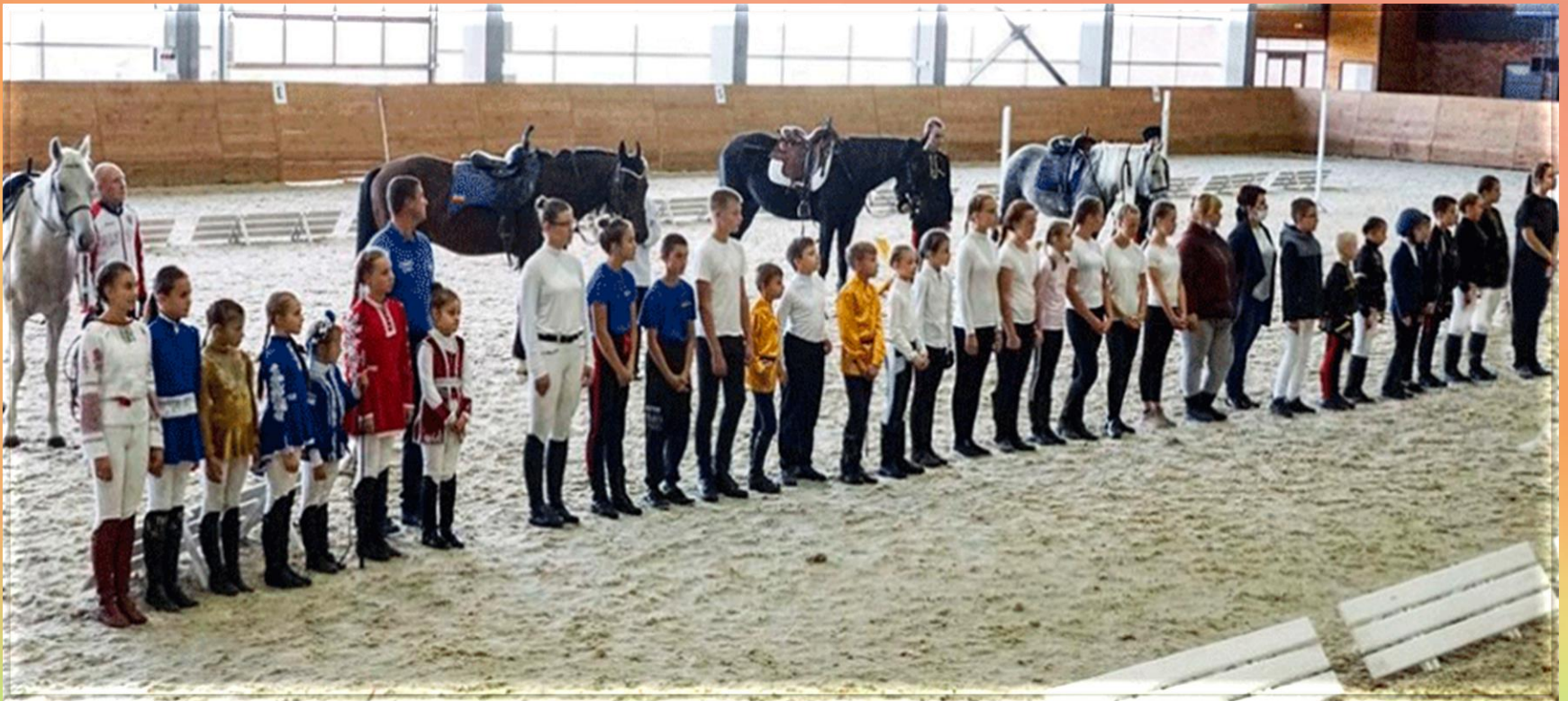
На фото: спортсмены конно-спортивных клубов городов Саратова, Волгограда, Балашова, Пензы - участники соревнований по джигитовке в КСК «Гермес» (г.Саратов)

Мы не ставим цели воспитания спортсменов профессионального уровня. Перед нами стоит задача воспитания здорового, уверенного в себе, всесторонне развитого человека. Но мы понимаем, что любой спорт, даже любительский, не может обойтись без соревнований.