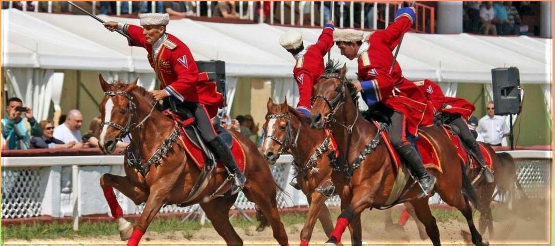
На фото: соревнования Первенства России по джигитовке