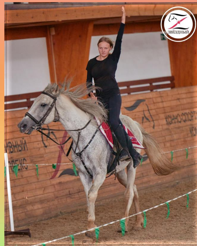
На фото: спортсмены КСК «Фортуна-С» на соревнованиях по джигитовке